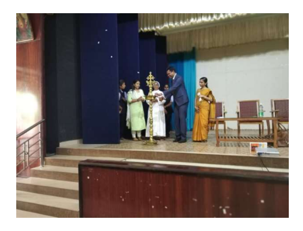
ERNAKULAM - JAI BHARATH ARTS AND SCIENCE COLLEGE 7TH NOVEMBER, 2019